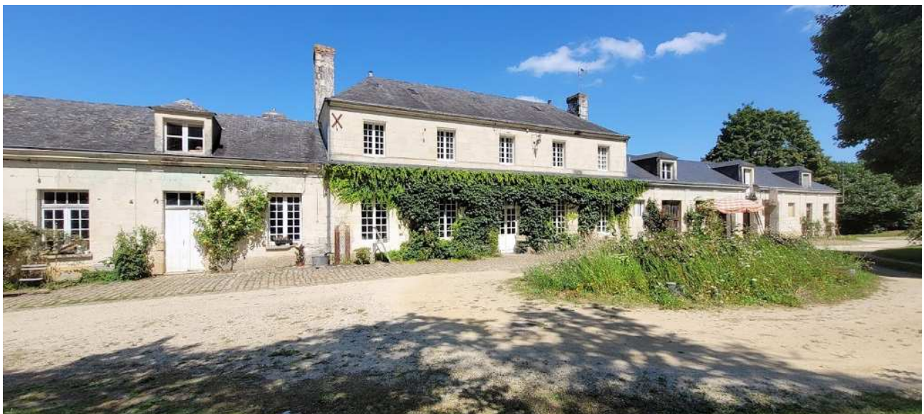
l'atelier aura lieu à la Mesnagerie, Jarzé village